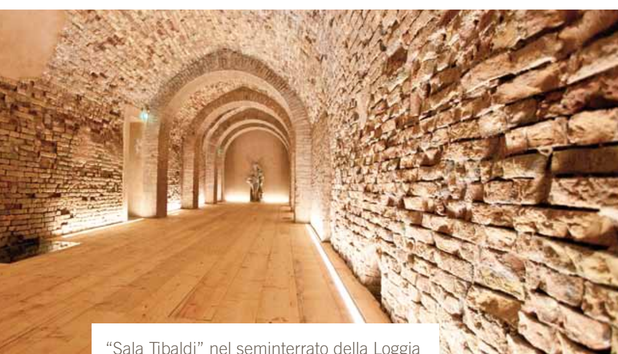
"Sala Tibaldi" nel seminterrato della Loggia

La Camera di Commercio di Ancona è proprietaria della Loggia dei Mercanti di Ancona, edificio monumentale splendido esempio di gotico fiorito veneziano del XV secolo.