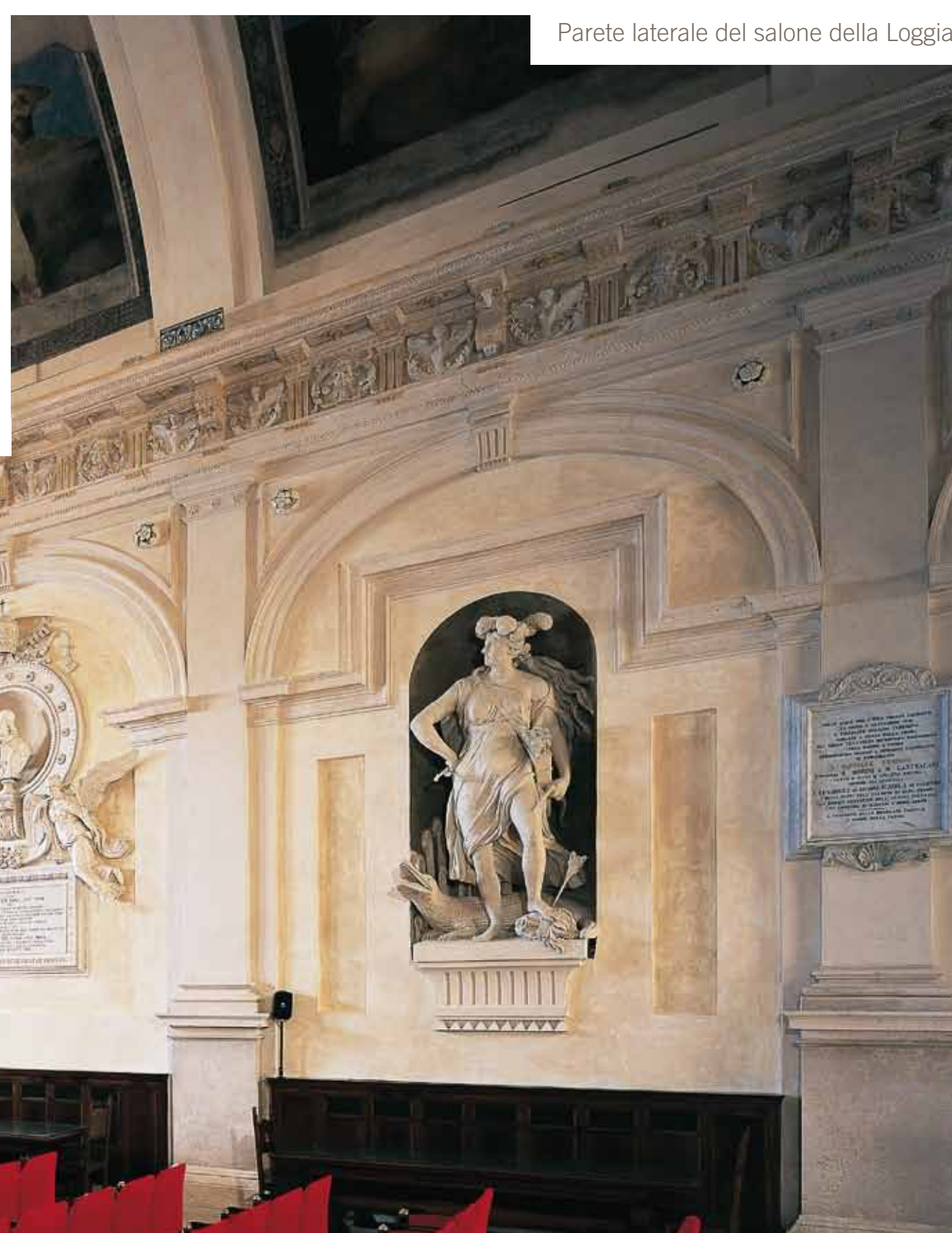
Parete laterale del salone della Loggia

Il palazzo, collocato al centro di Ancona, è facilmente raggiungibile sia con i mezzi privati (dal vicino parcheggio Traiano) sia con i mezzi pubblici (dalla stazione ferroviaria); inoltre la sua ubicazione lo rende comodo punto di partenza per una piacevole visita alla città.