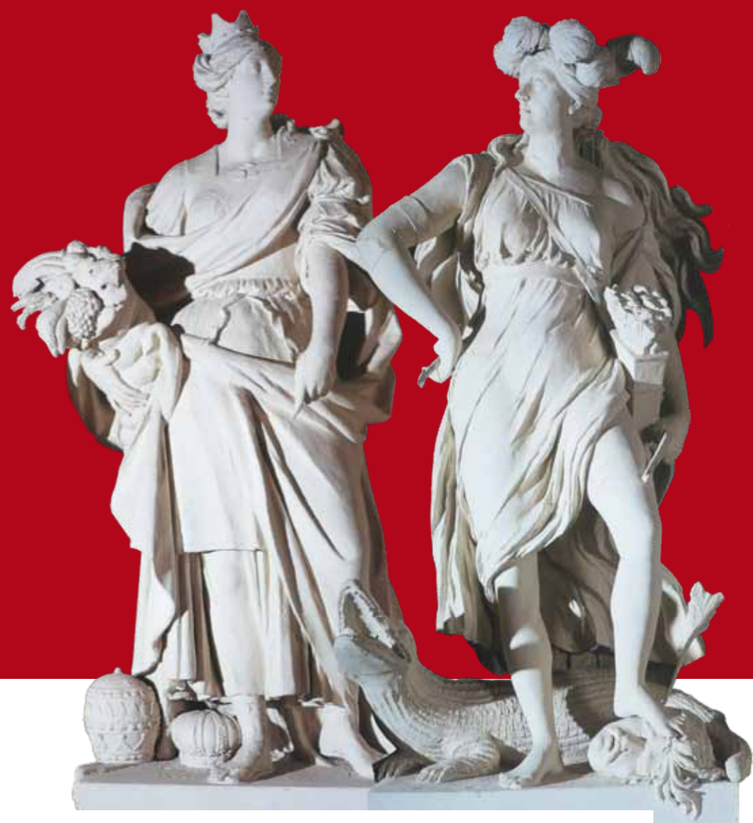
Statue "Europa" e "America" del salone della Loggia